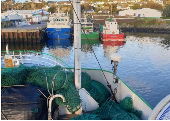
Figure 1 CLS Triton Advanced on an Irish Vessel

Mediante un proceso de licitación abierta para un sistema avanzado de monitoreo de embarcaciones, SFPA le otorgó a CLS Fisheries el contrato para la interconexión, instalación y activación de toda la flota industrial con bandera irlandesa, estimada en 300 embarcaciones. CLS proporcionó su terminal VMS de última generación, TRITON, que cumple con todos los requisitos de la PPC. CLS Fisheries es ahora el proveedor exclusivo de VMS en Irlanda.